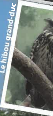
Le hibou grand-duc