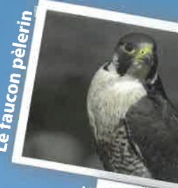
Le faucon pèlerin