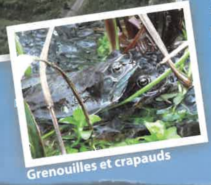
Grenouilles et crapauds

Le site de la carrière abrite plusieurs espèces animales rares ou remarquables. Elles trouvent ici les conditions nécessaires à leur survie et à leur reproduction.