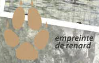
empreinte de renard

La faune aquatique se multiplie par l'intermédiaire des canards et poules d'eau, qui lors de leurs passages déposent des œufs de poissons qu'ils transportent au creux de leurs pattes. Les eaux de la carrière sont appréciées par les pêcheurs pour leurs brochets, carpes, tanches, perches, gardons, ... Retrouvez les différents points de vente des titres de pêche dans la rubrique Infos pratiques de ce dépliant.