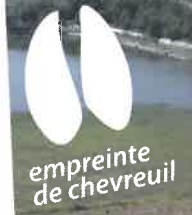
empreinte de chevreuil