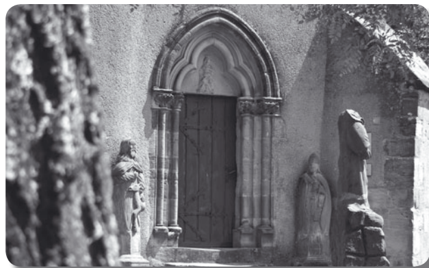
Portail de la chapelle

Deux statues de la suite des Saints Auxiliaires, Gilles et Erasme, encadrent le portail. Elles furent placées là au début du XXe siècle.