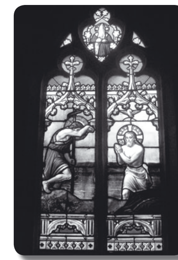
Vitrail de la baptistère

Ancienne chapelle de la famille Bayer de Boppart, adjonction du milieu du XVe s. Croisées d'ogives interpénétrées avec quatre écus aux intersections. Vitrail de Maréchal (1850).