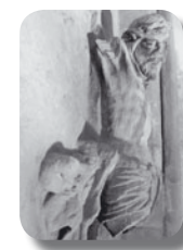
Crucifix XVe s.