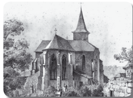
Chevet de la Collégiale par Migette en 1867

D'un style gothique des XIIIe et XIVe siècles, l'église présente un aspect assez massif et trapu. L'édifice est construit en pierres de grès rose-ocre d'un bel appareil régulier, sauf au transept nord recouvert d'un enduit. L'ensemble est couvert d'ardoises.